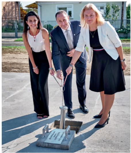
A bölcsőde alapköletétele szeptember 28-án.

Bölcsőde Véleményem szerint városunk jövőjét alapvetően meghatározó beruházást indítottunk el szeptemberben egy új bölcsőde építésének megkezdésével. Miután a régi bölcsődét az előző városvezetés 2016-ban értékesítette, ezért új helyen, új épületet kell építenünk a város jövőjének, értékes fiataljaink és dolgozó szülei helyben tartásának