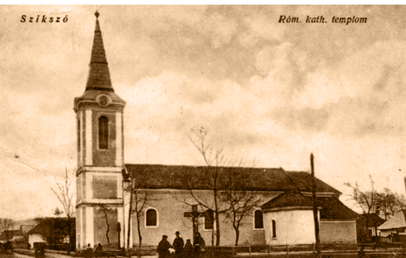
Szikszó, római katolikus templom, 1928.

1950-ben létrehozták az úgynevezett békepapi mozgalmat az egyházak társadalmi befolyásának megtörésére. „A papi békemozgalmat fel kell használni a katolikus alsópapság és a felső vezetők szembeállítására” – jelentette ki Kádár János. A kulcs-helyekre juttatott békepapok útján a plébániákat is állandóan