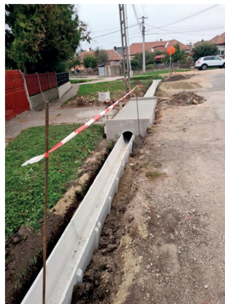
Javában zajlik a 100 millió Ft-os beruházással készülő csapadékvíz-elvezetési rendszer építése.

Csapadékvíz-elvezetés A 100 millió Ft-os beruházással a Liszt Ferenc, Munkácsy, Lőcsei utcák egy részén és a Thököly utca egészén összességében 1286 méter árok (részben nyílt, részben zárt) építésével a település ezen mély részéről átemelő szivattyúk segítségével visszük el a csapadékvizet. A munka már ja-