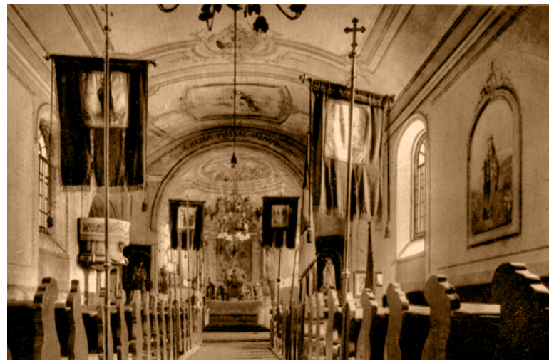
Szikszó, római katolikus plébániatemplom belseje.