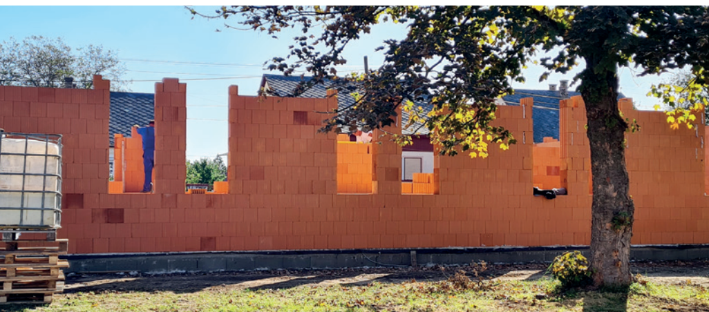
Október közepére már „kinöttek a földből” az új bölcsőde falai.

Pályázati forrásból folyamatban Az uszodához kapcsolódó két kültéri medence közbeszerzés kiírása előtt van, az új piac és a Hernád felé vezető út építése szintén. A kivitelezések megkezdése 2024 elején várható.