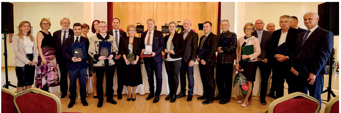
Szikszó Város Napján a képviselő-testület döntése alapján adtuk át kitüntetések. Gratulálunk a díjazottaknak, további munkájukhoz sok sikert kívánunk!