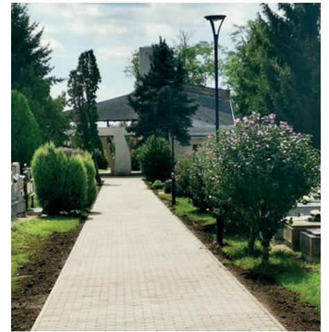
...térkőburkolattal láttuk el.

eredmény azonban az, hogy a temetőben gyakran használt, korábban füves, esőben sáros utakat térkőburkolattal láttuk el. A mellékelt képeken látható a változás. A jövő évben, 2024-ben, a kamerarendszer kiépítése következik.