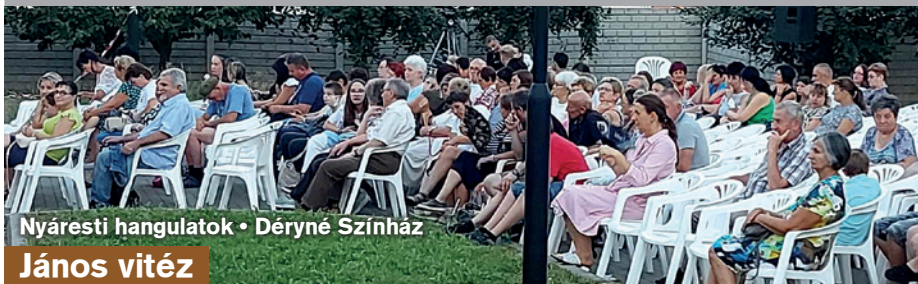
Nyáresti hangulatok • Déryné Színház