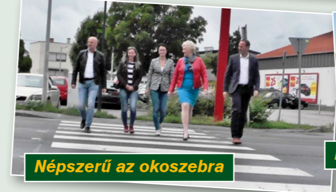
Népszerű az okoszebra