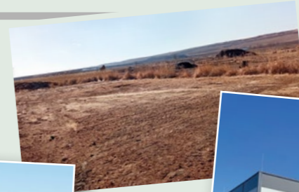
Már bérlője is van az iparcarnoknak