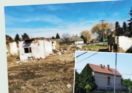
Új játszótér létesült a „lépcsős híd”-nál