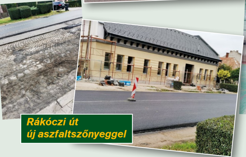
Rákóczi út új aszfaltszőnyeggel