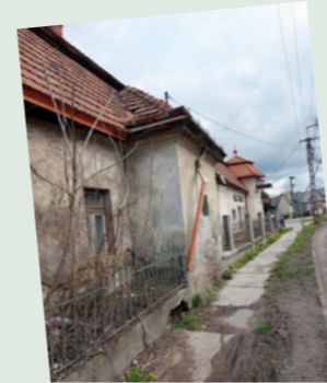
A József A. és Bolt u. közötti járda