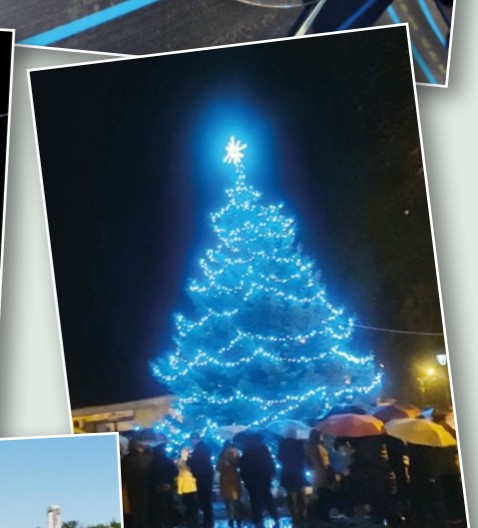
Mindannyiunké a város karácsonyfája, immár második éve