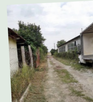
A Kassai „köz” végre nem sáros