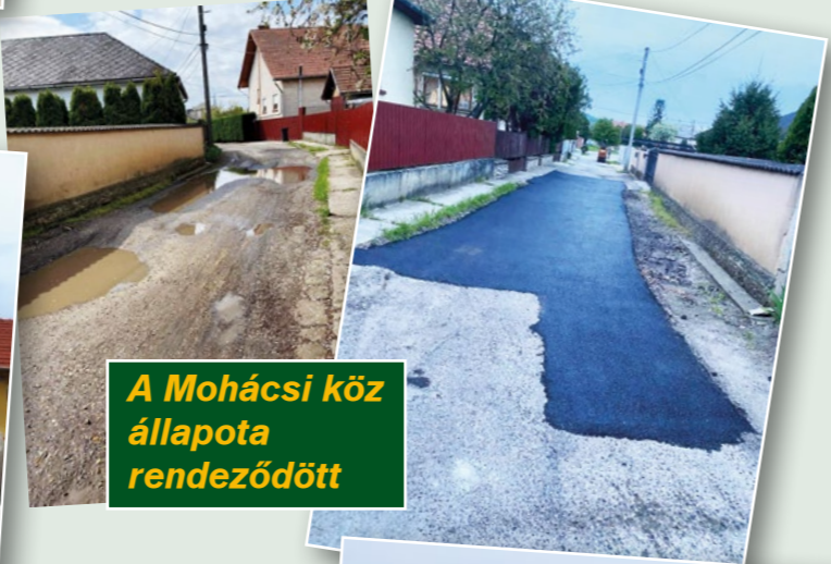
A Mohácsi köz állapota rendeződött