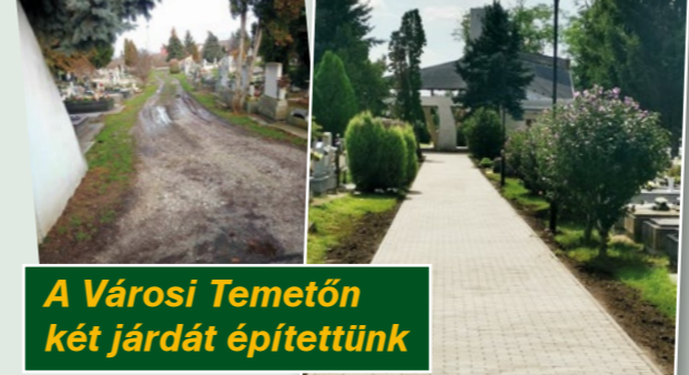
A Városi Temetőn két járdát építettünk