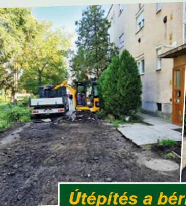
Útépítés a bérházaknál