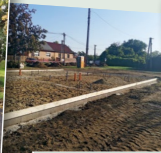
„Kinőtt” a földből a bölcsőde