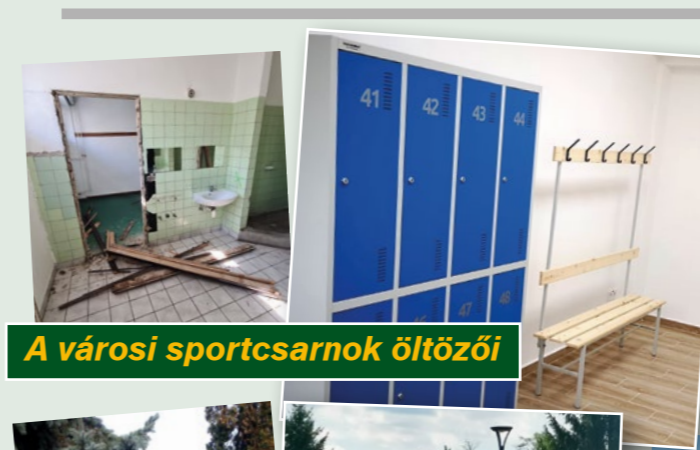
A városi sportcsarnok öltözői