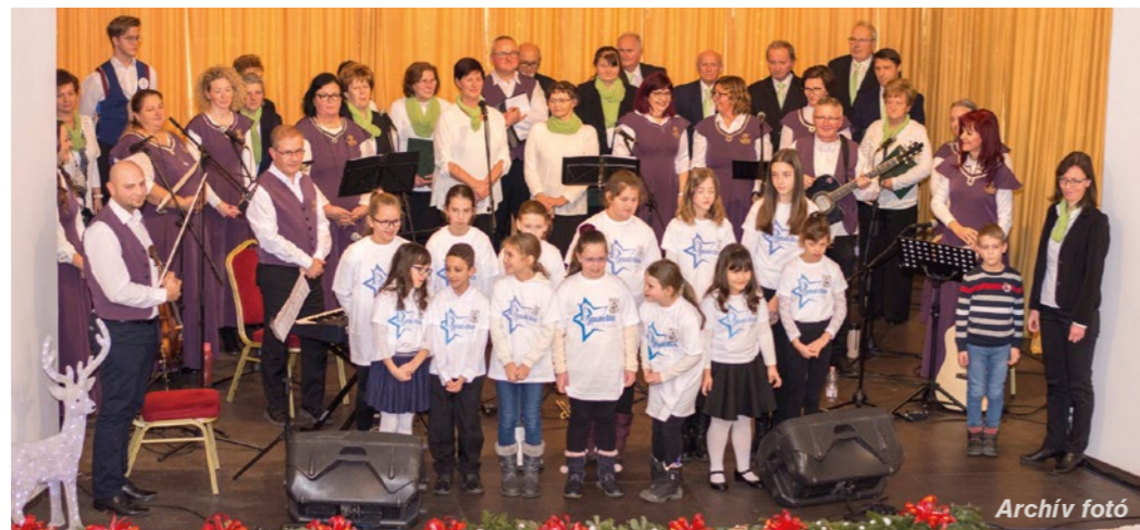
Mindig megható és lélekemelő a Vadmész Kórus, a Hajnalcsillag Együttes és a Református Felnőttkórus koncertje.