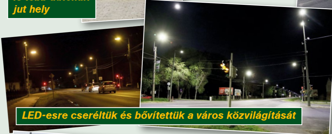
LED-esre cseréltük és bővítettük a város közvilágítását