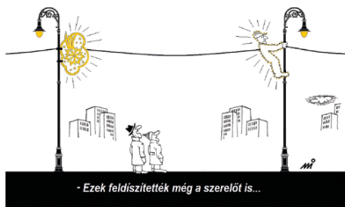
- Ezek feldíszítették még a szerelőt is...