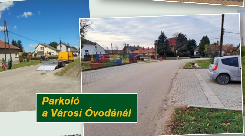
Parkoló a Városi Óvodánál