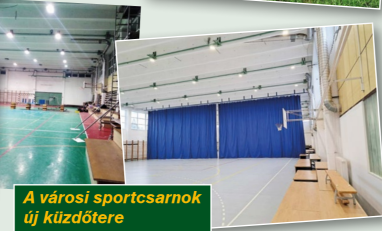
A városi sportcsarnok új küzdőtere