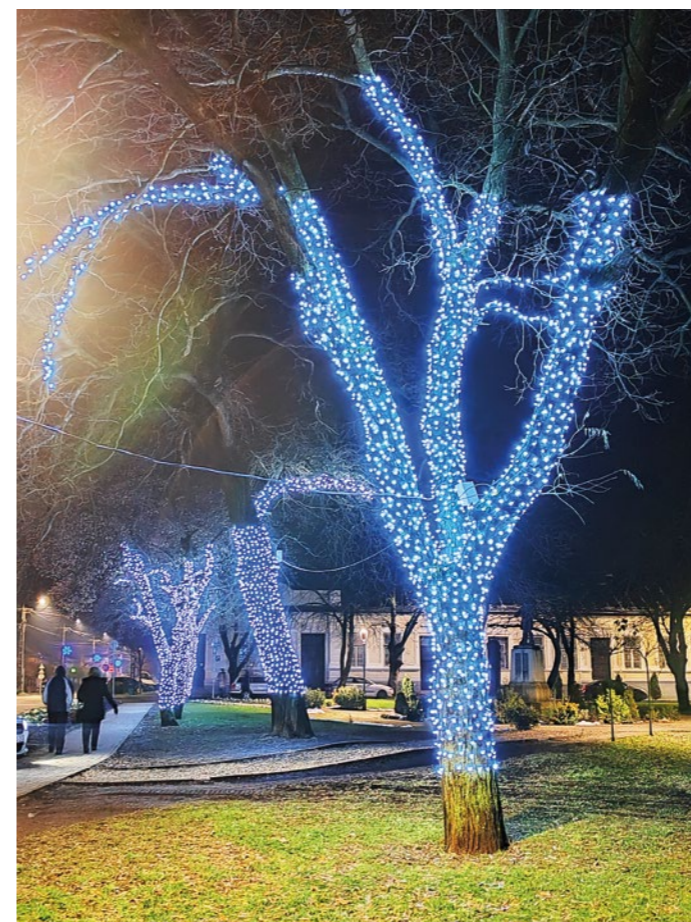
Díszvilágítást kaptak a polgármesteri hivatallal szemben lévő tölgyfák.