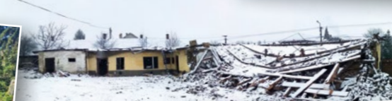
Népszerű a Közösségi Ház a romok helyén