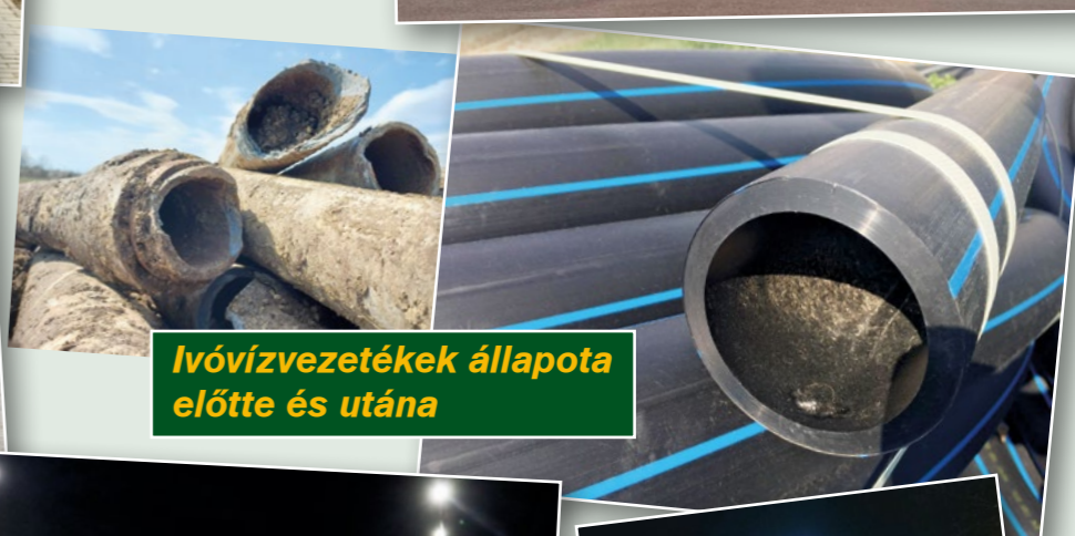
Ivóvízvezetékek állapota előtte és utána