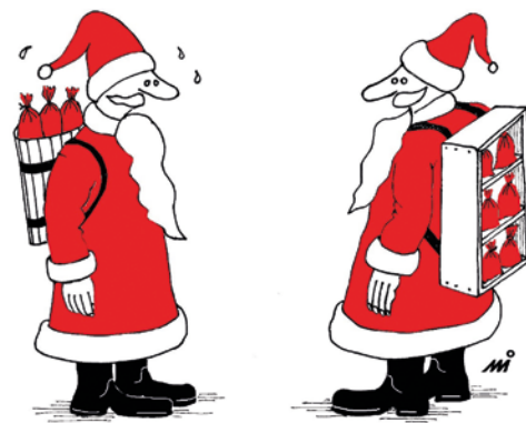
- Újítottam... Elegem van a putnyból...