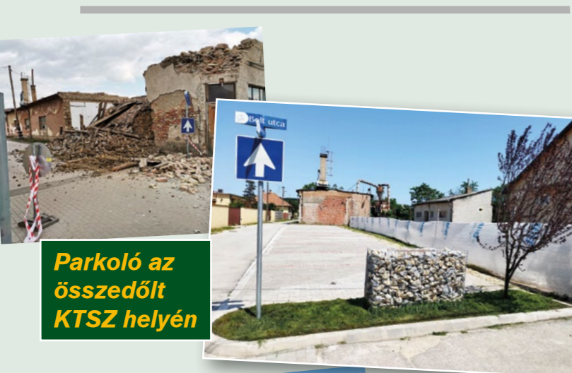
Parkoló az összedőlt KTSZ helyén