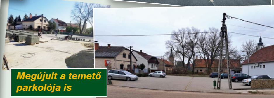
Megújult a temető parkolója is