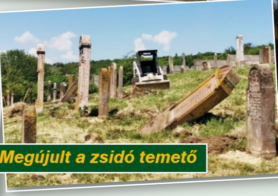
Megújult a zsidó temető