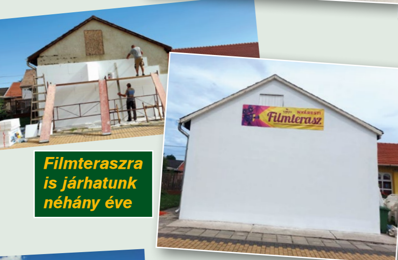
Filmteraszra is járhatunk néhány éve