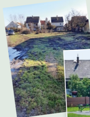
Üres telek helyett kondipark