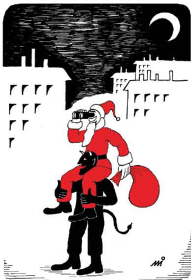
- Még ott látok egy cipőt az ablakban...