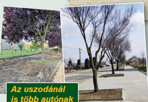
Az uszodánál is több autónak jut hely