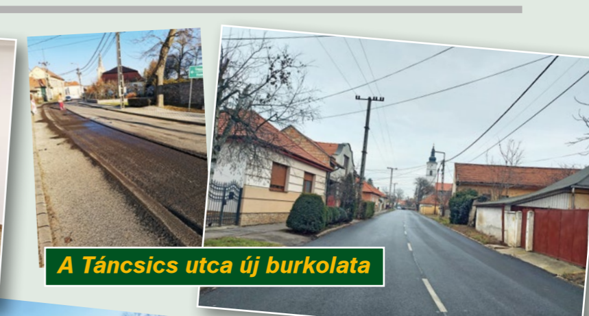
A Táncsics utca új burkolata