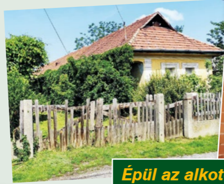
Épül az alkotóház a Gárdonyi utcán

Év végén az ember számvetést készít. Engedjék meg, hogy ezt a számvetést az első egészségügyi- vagy energiaválságtól mentes évben kiterjesszem az elmúlt évekre és „előtte-utána” képpárokban mutassam be a változásokat.