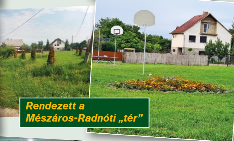
Rendezett a Mészáros-Radnóti „tér”