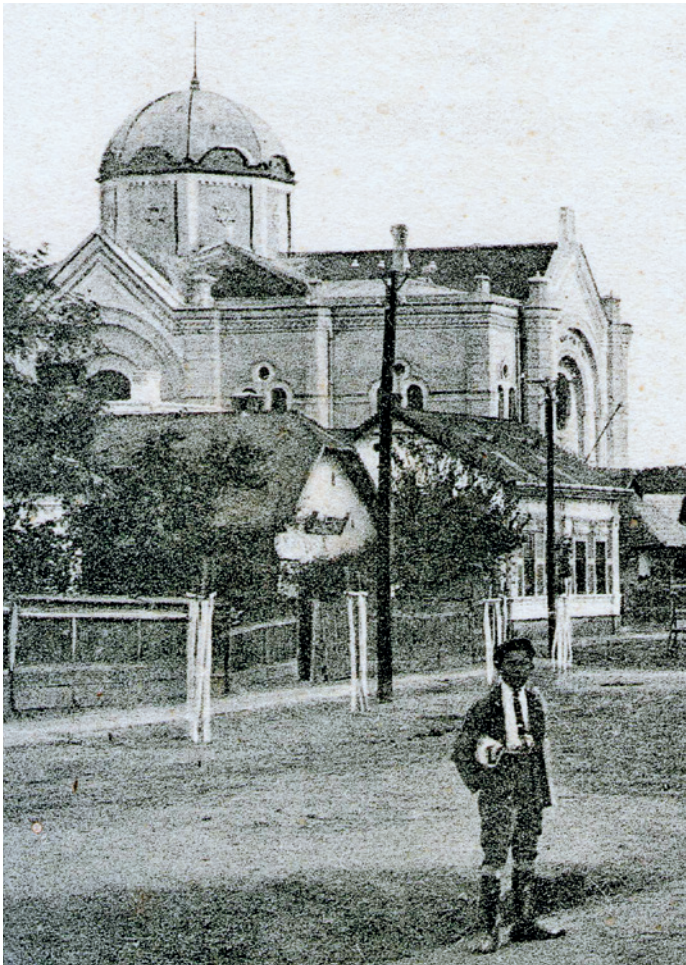
Korabeli képeslap részlete: „Üdvözlés Szikszóról. Nagy utca a zsidó templommal.”