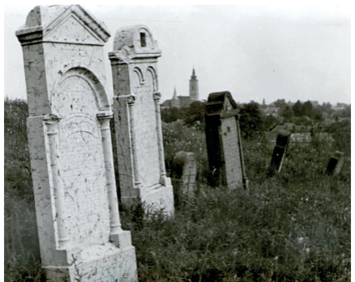
Zsidótemető a Magyar-hegy délnyugati lejtőjén.