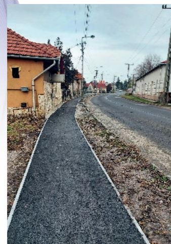
„Építettünk járdát – alatta csapadékvíz-elvezetést létrehozva – 110 méteren a Bolt utca és a József Attila utca között.”

Építések: az idén tavasszal adtuk át véglegesen a városi óvoda és az uszoda melletti parkolókat összesen 700 négyzetméteren. Építettünk járdát – alatta csapadékvíz-elvezetést létrehozva – 110 méteren a Bolt utca és a József Attila utca között. Folytatódott a Magyar Közút és a Colas kivitelezésében a tavaly