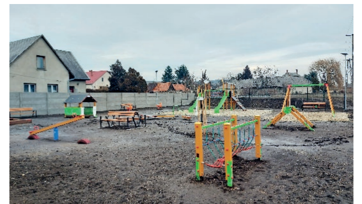
„Elkészítettük és átadtuk a belváros első, Szikszó második játszótérét.”

áll rendelkezésre, így a feladat a hivatalra marad elsősorban. Köszönöm az ott dolgozóknak, a jegyző asszonynak a hozzáállást és köszönöm a bizottságok és a képviselő-testület konstruktív munkáját. Egy évvel ezelőtt írtam arról a csapatszemélyről, ami a testületet jellemzi. A szellemiség maradt, a segítség és a kitartás is, köszönöm.