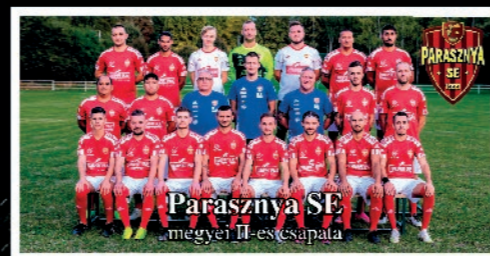
Parasznya SE megyei II-es csapata