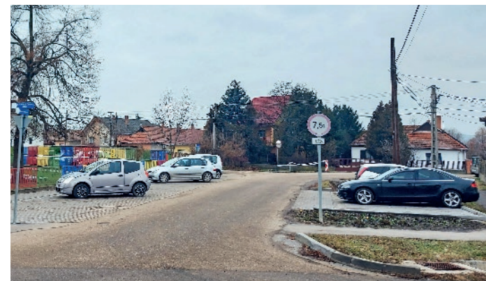
„...tavasszal adtuk át véglegesen a városi óvoda és az uszoda melletti parkolókat, összesen 700 négyzetméteren.”

500 méteren felújított Rákóczi út után a Táncsics, Bajcsy-Zsilinszky utcák teljes aszfaltozása. Így a lámpás kereszteződéstől egészen a pálinkafőzdéig új utat használhatunk, összesen 1800 méteren. Beüzemeltük az „okoszebrát”, amely biztonságosabbá teszi az átkelést a főúton. Elkészítettük és átadtuk a belváros első, Szikszó második játszótérét. Pályázati forrásból a zsidó temető legrégebbi, veszélyben lévő síremlékeit stabilizáltuk és archiváltuk. Telepítettünk faházat a kertészetbe, befejeztük