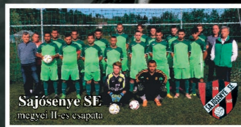
Sajósenye SE megyei II-es csapata