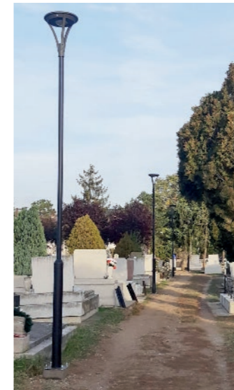
„Mindenszentek előtt öt napelemes kandelábert telepítettünk a temetőben.”

A jövő évben elkezdjük a belterületi csapadékvíz-elvezetés javítását. Városunk egészét érinti a probléma, így először a terveket készítettük el, amelyek alapján 2022-ben a legmélyebb részeken (Liszt Ferenc, Dózsa György utcák és környékük) indulunk. Tervezzük a város belterületi kerékpárútját, amelyet a Magyar Közúttal közösen valósítunk meg. Szintén sikeres pályázat eredménye lesz egy új kültéri kondipark a Temesvári utcán. Készül a sportszarnok küzdőterét megfelelő térelválasztó függöny az iskolai testnevelés órák megkönnyítése érdekében. Belterületi útpályázaton a Kazinczy utca és a Miskolci utca bérházak előtti szakasza is új