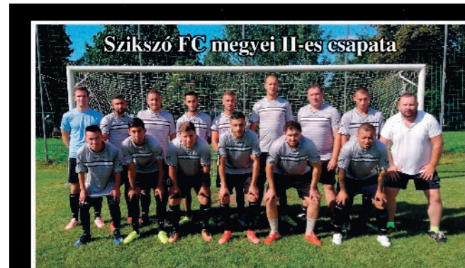
Szikszó FC megyei II-es csapata