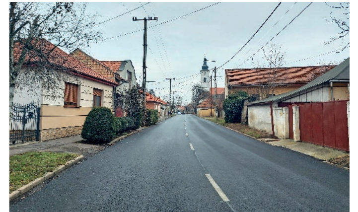
„Folytatódott ... a Táncsics, Bajcsy-Zsilinszky utcák teljes aszfaltozása. Így a lámpás kereszteződéstől egészen a pálinkafőzdéig új utat használhatunk, összesen 1800 méteren.”

Nehéz felsorolni, mennyi pályázat, projekt és munka fut párhuzamosan. Koordinálásukhoz külön szakembereink nem