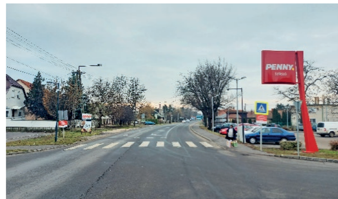
„Beüzemeltük az „okoszebrát”, amely biztonságosabbá teszi az átkelést a főúton.”

Vásárlások: A város ingatlanvagyonát 100 milliós nagyságrendben növeltük: megvásároltuk a focipályát, az uszoda és a pálya közötti terület egy 9000 nm-es