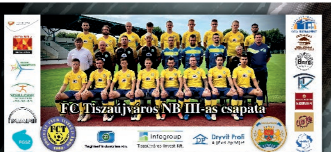
FC Tiszaujváros NB III-as csapata