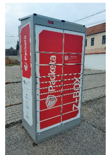
„...csomagátadó automatát telepítettünk a katolikus templom parkolója mellé...”