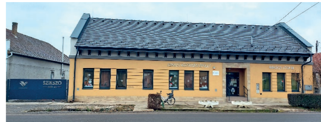
„...befejeztük a Községi Ház kivitelezését, belső kerítését és udvarát.”