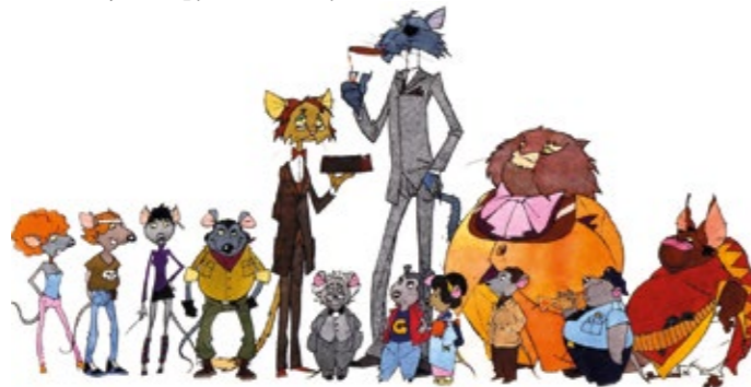
Július 8-án a Macskafogóval indul a „Nyáresti Filmterasz”.

A következő filmeket majd az online szavazás és a közönség véleménye alapján választjuk