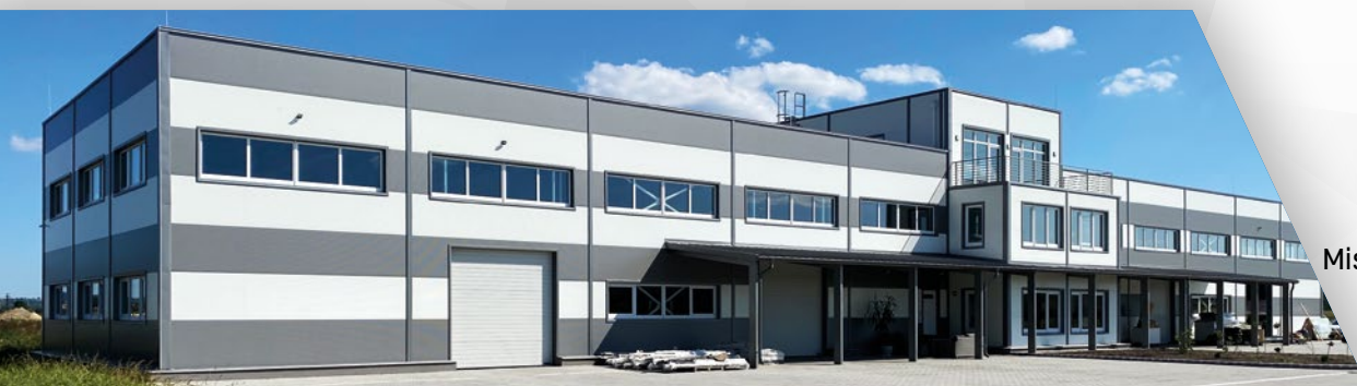
Elkészült az önkormányzati tulajdonú, mintegy 1000 m 2 -es üzemcsarnok, melyben már elindult a termelés.

Gáz: 1000 m 3 /óra, Áram: 5-8 MW Ivóvíz: 300 m 3 /nap Tűzvíz: 1800 l/perc Szennyvíz: 500 m 3 /nap.